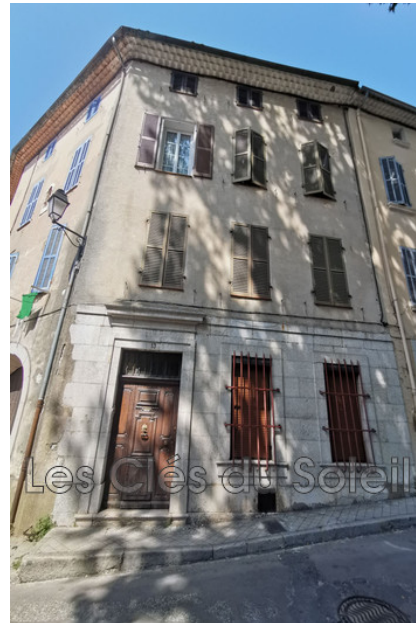
Maison 12658 Brignoles

BRIGNOLES à découvrir cette très belle maison bourgeoise de 200 m 2 , avec grand garage, une cave Située en coeur de ville Elle offre en rez-de chaussée un hall spacieux desservant les étages et le séjour, une cuisine, un cellier, un accès vers l'extérieur côté Nord donnant sur la place de parking et un accès intérieur pour la belle cave voutée. Au premier niveau : 2 chambres dont une salle de bain, un dressing et un toilette. Au second étage : 2 chambres, une salle d'eau et toilette. Au 3ième étage : 1 chambre et 2 pièces plus petites, un toilette une salle d'eau. Un dernier demi-niveau vous découvrirez une agréable terrasse de 3 m 2 . S'ajoute à l'ensemble un très beau garage sur une grande hauteur de 40m 2 environ. Nous contacter au 04 94 37 11 03 - LES CLES DU SOLEIL BRIGNOLES