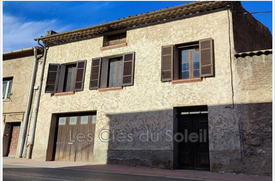
Villa 12102 Carcès

Carcès, centre du village, venez découvrir cette maison de village T4 à fort potentiel en terme de surface. Au Rdc vaste garage, terrasse couverte et jardin, salle d'eau avec WC ; à l'étage plusieurs pièces dont 2 séjours avec cuisines, 2 grandes chambres, WC, cellier et débarras ; au 2ème étage un vaste grenier sous pente aménageable. Travaux de rénovation à prévoir. Les Clés du Soleil Brignoles.